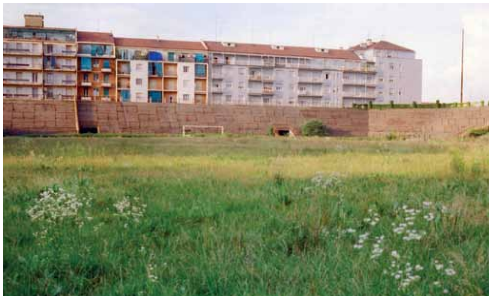
Poetica immagine laddove sul prato di un Filadelfia abbandonato... nascevano le margherite