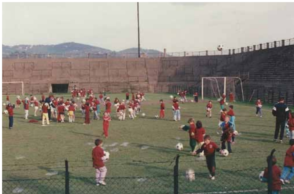
Stupenda immagine del Filadelfia dove i pulcini granata giocano festanti. Così era negli ultimi anni... poco prima del suo triste e assurdo abbattimento