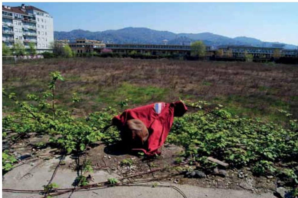
Suggestiva e poetica immagine di un Filadelfia abbandonato... ai suoi ricordi