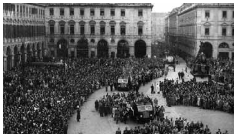
Una folla immensa e commossa partecipò ai funerali dei 31 caduti della tragedia di Superga

Un personaggio che ricordo con affetto è il presidente Ferruccio Novo, un vero signore, molto umano. Quando nel 1951, allora ragazzino, fondammo i “Fedelissimi”, eravamo una trentina di giovani tifosi e sentivamo l’esigenza di seguire il Toro non solo in casa, ma anche in trasferta. A quei tempi non avevamo i mezzi economici per sostenere le spese, quindi pensai di chiedere aiuto al presidente Novo, presentandomi timido e tremante nella sede granata di via Alfieri numero 6. Mi ricevette con cordialità e con modi affabili; propose di regalarci una quindicina di biglietti per le partite casalinghe del Toro, che noi avremmo rivenduto, procurandoci così una discreta somma che ci avrebbe permesso di ammortizzare le spese del pullman per le trasferte, le quali per la maggior parte erano abbastanza vicine, quindi abordabili. Non dimentico la signorilità del Presidente Novo, per me, il più grande che il Toro abbia avuto!