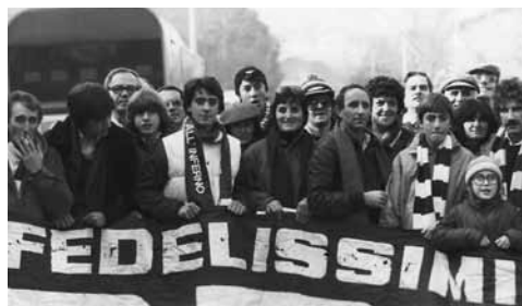
I "Fedelissimi" di ieri...