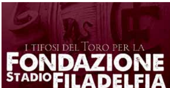
Logo della "Fondazione Stadio Filadelfia"