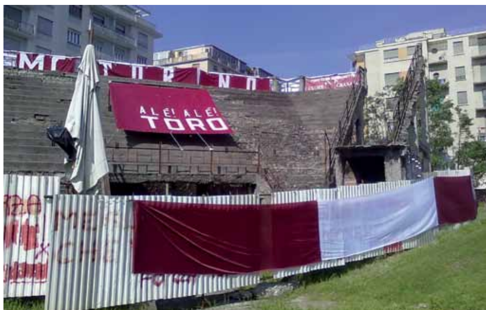
Tra i ruderi del Filadelfia... c'è stata la vigile presenza dei tifosi granata

Mi son pentita, quel giorno del 1997 in cui il "Fila" fu abbattuto, per non aver potuto far nulla e comunque, quell'evento funesto mi ha dato la forza e la rabbia negli anni seguenti, di far sì che la distruzione non diventasse uno scempio.