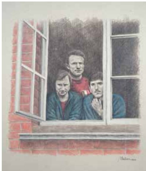
Poetica raffigurazione di tre campioni granata affacciati ad una finestra sul cielo: Valentino Mazzola, Giorgio Ferrini e Gigi Meroni