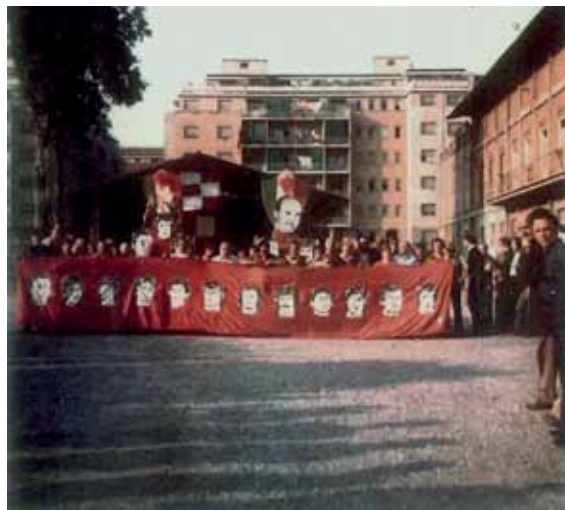
Il cortile di ghiaia del Filadelfia, da dove partirono i festeggiamenti per la conquista dello scudetto

Per me, essere del Toro è un modo di vita, ben diverso da quello che può essere catalogato come tifo calcistico. È sentirsi parte di un "qualcosa" difficilmente spiegabile, è una "cosa" che ti senti dentro e che prescinde totalmente dai risultati sul campo. È commuoversi se vedi un bimbo con la maglia granata, è entrare al Fila e viverlo come un Tempio senza tempo, sentirne lo spirito penetrarti dentro, è piangere ogni 4 Maggio in mezzo a tanti fratelli, davanti a dei nomi scritti su una lastra di marmo, è passare ogni tanto in Corso Re Umberto a dare una carezza a Gigi.