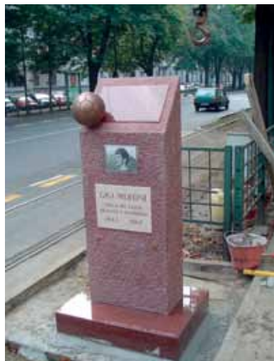
Il cippo dedicato a Gigi Meroni