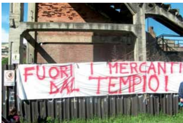
Eloquente striscione di protesta al Filadelfia ormai abbandonato