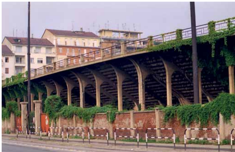
Il Filadelfia visto dall'esterno... di già in stato di abbandono