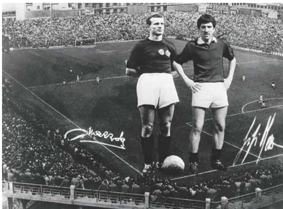
Suggestiva fotocomposizione ad opera di Fulvio Rossi in cui è rappresentato il mitico Filadelfia su cui sono sovrapposte le immagini autografate di due grandi e amati campioni granata: Valentino Mazzola e Gigi Meroni