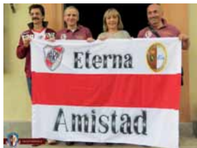
Gli amici del Museo del River Plate sanciscono l'eterna amicizia fra i due storici Musei, fra i tifosi granata e platensi e fra le due società