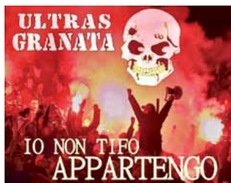
Manifesto d'esistenzialismo Ultras granata

Ripeto, non mi sono tirato indietro: abbiamo iniziato questa nuova esperienza con responsabilità e grande impegno e nel giro di qualche mese direi che siamo stati all'altezza dei nostri predecessori.