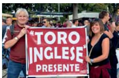
Il simpatico “Toro Inglese” con la sua insegna prima di una partita del Toro