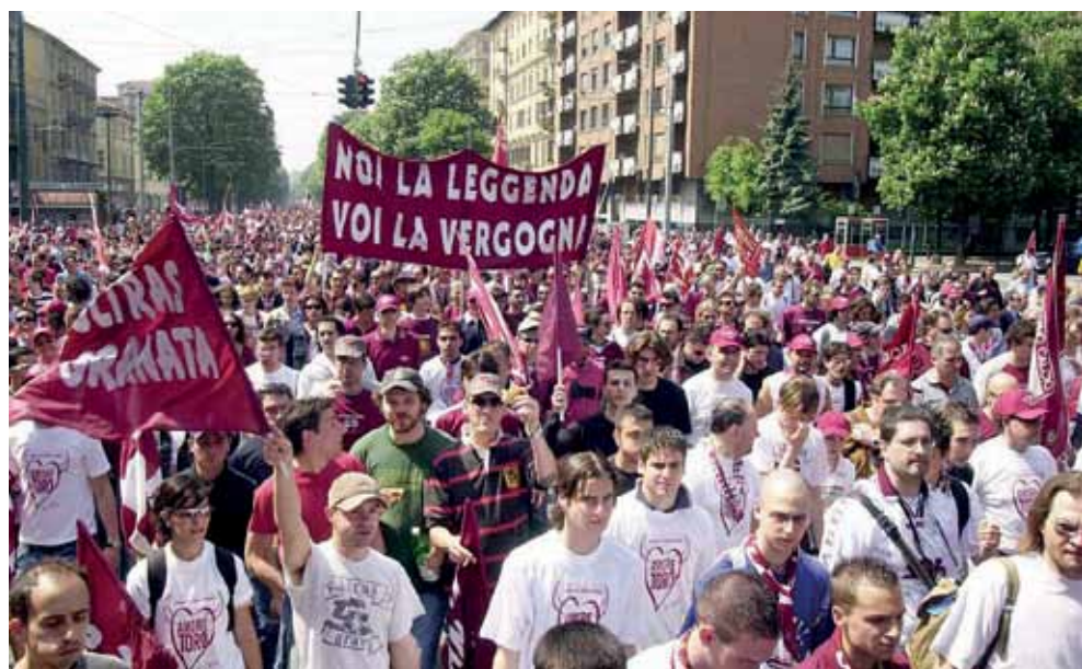
Seconda immagine della marcia dell'Orgoglio Granata: il popolo granata sfila lungo corso Re Umberto