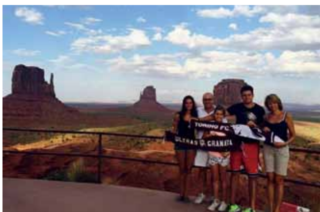
Una famiglia di tifosi granata posa con le sciarpe granata del Toro... addirittura alla Monument Valley negli Stati Uniti