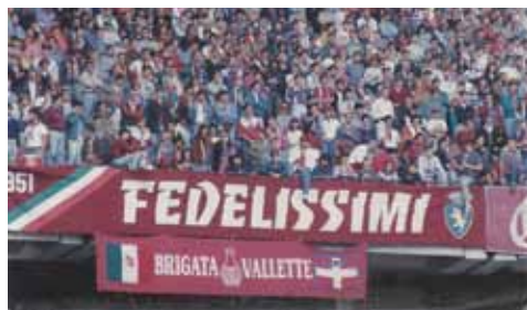
... e quelli di pochissimi anni fa'