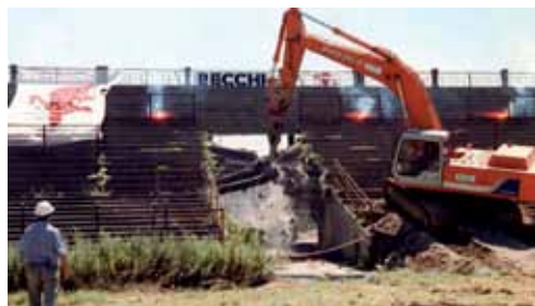
1997: le ruspe abbattevano il Filadelfia

Non è un campo d'allenamento, non è una struttura, non è un cortile e non è un luogo. È la mia adolescenza e quella di tanti altri. È la sensazione che tutto ciò che lo circonda è falso, sbagliato, artefatto, costruito sull'ingordigia e l'egoismo. Il Filadelfia sono gli amici che restano e quelli che se ne sono andati portando con loro emozioni uguali alle mie. È gli abbracci con sconosciuti, gli sguardi complici, i pugni al cielo, contro il cielo. È un simbolo che mi porto dentro, abbattimento compreso. Lo rifaranno. Bene, era ora. Ma è passato troppo tempo, troppe parole, troppo di tutto. Il mondo attorno è lo stesso di allora, forse peggiore di allora, e anche io non sono lo stesso e non certo per colpa dell'età. Spero che il rivederlo, anche diverso, riesca a farmi riavere la convinzione che valga ancora la pena lottare per un minimo di giustizia, di lealtà, di coraggio, di solidarietà in una società che premia i valori contrari a questi. Se rinascerà il Fila, forse rinasceremo noi.