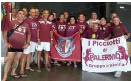
Il club di tifosi granata siciliani "I Picciotti di Palermo"