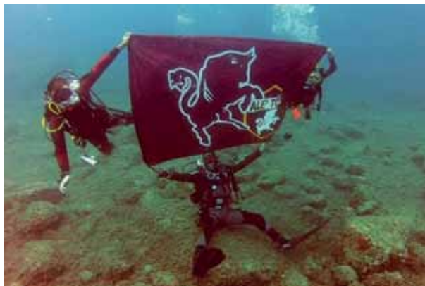
Tifosi granata con la bandiera del Toro... in fondo al mare