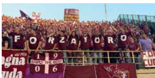
I tifosi granata in trasferta al “Franchi” di Firenze con le pittoresche maglie granata con inciso “Forza Toro”