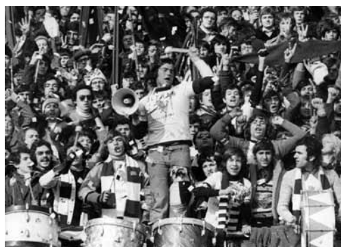
Giovani Ultras primi anni settanta con le moderne innovazioni dei tamburi e dei megafoni