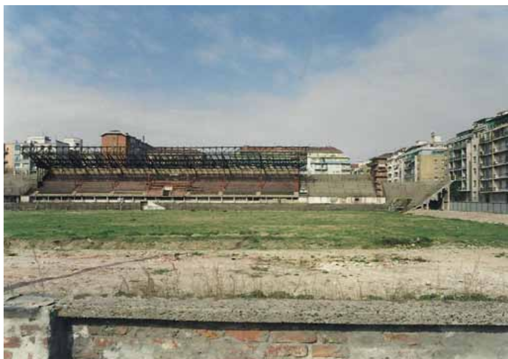
1997: così iniziava il vergognoso abbattimento del glorioso Filadelfia