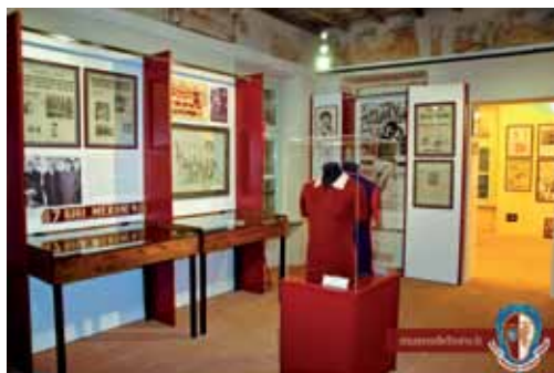
Due sale del bellissimo Museo del Toro di Villa Claretta a Grugliasco

Sovente i tifosi si ricordano di me, anche perché ho condotto per 10 anni la trasmissione “Tuttotoro” dall'emittente Teletime e per 2 anni sono stato a Televox; inoltre sono stato spesso ospite a “Cuore Granata” ed alle varie trasmissioni sul Toro. Ora, ho ben ottant'anni e attualmente non ho più la forza, né la voglia di uscire, comunque telefono spesso a queste trasmissioni esternando il mio parere sulle vicende della squadra.