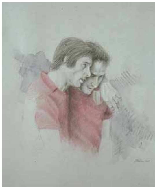
Fantastico disegno che raffigura i mitici "gemelli del goal" Paolo Pulici e Francesco Graziani