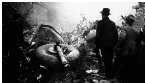
Le immagini dello schianto di Superga ove perirono i campioni del Torino

Dopo alcune ore venne a casa mia un amico: mi disse che aveva appena appreso dalla radio che erano morti tutti i giocatori del Toro ed io... non ci potevo credere! Rimasi tre giorni a letto a piangere... Erano morti i miei campioni.