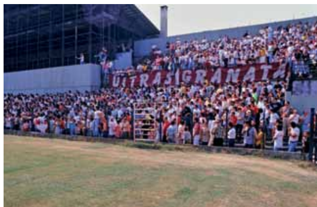
I tifosi granata affollano il Filadelfia per una gara delle giovanili

Inoltre non bisogna dimenticare che al Filadelfia nasceva il vero “spirito granata”, tramandato dalle vecchie alle nuove generazioni, quindi per finire... spero che sia la volta buona per il “Fila”.