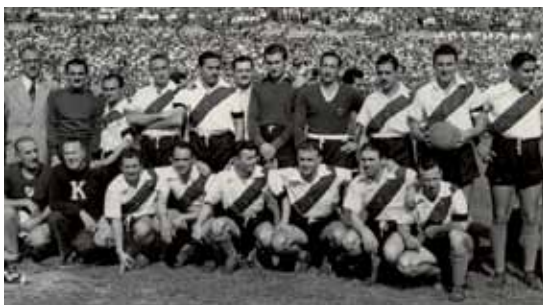
I campioni del River Plate a Torino nell'indimenticabile partita in onore dei 31 Caduti di Superga

“Sono nato da famiglia granata e non ho mai nemmeno lontanamente pensato di poter tifare per qualsiasi altra squadra.