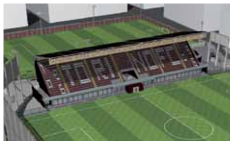
Il progetto del nuovo Filadelfia

Sempre di Michele Monteleone, il seguente bellissimo articolo sul Filadelfia: