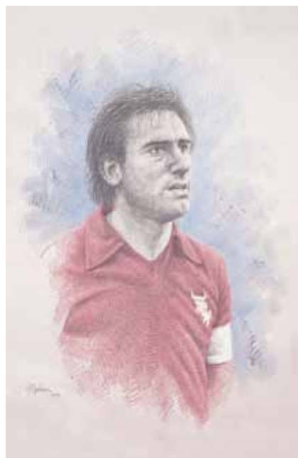
Francesco, per tutti affettuosamente Ciccio Graziani, grande bomber granata