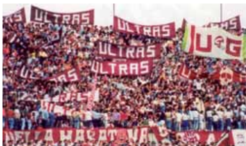
Bellissima immagine degli Ultras in curva Maratona

“Sono nato il 16 Maggio del 1958 (faccio notare che il giorno dello scudetto ho compiuto 18 anni) e sono diventato tifoso del Toro nella maniera più classica: mio padre mi raccontava sempre del “Grande Torino”, del Filadelfia e dell’atmosfera che lì si respirava.