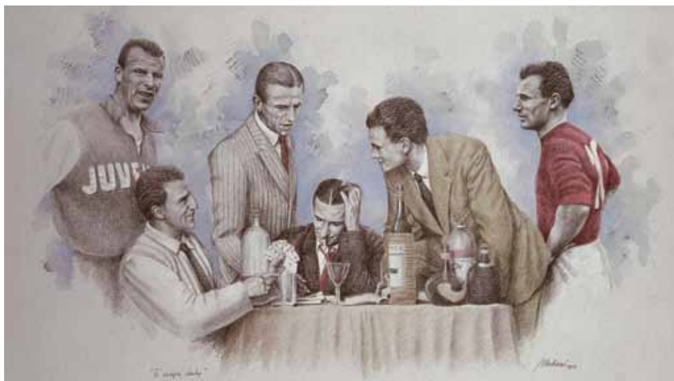
“È sempre derby”. Sono qui raffigurati i campioni granata e bianconeri. Da sinistra: John Charles, Carletto Parola, Franco Ossola, Guglielmo Gabetto, Gian Piero Boniperti e Valentino Mazzola