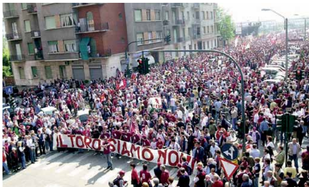
Prima immagine della marcia dell'Orgoglio Granata: la marea umana granata parte da via Filadelfia