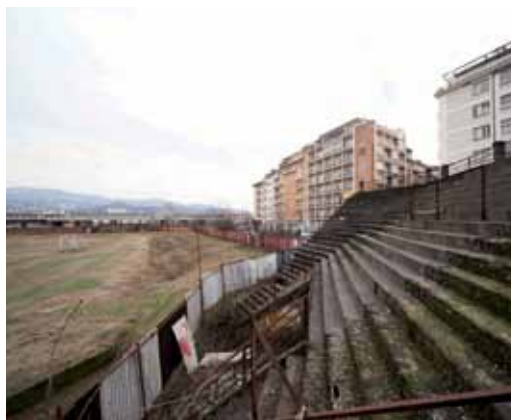
Immagine di un desolante Filadelfia abbandonato

“Il Toro rappresenta una grandissima parte della mia vita e mi ha fatto fare delle cose che senz’altro non avrei fatto per null’altro. La cosa più giusta da dire è che il Toro ha scandito la mia esistenza, è stato un compagno che ha avuto la precedenza... quasi su tutto; tipo spostamenti di appuntamenti di lavoro se c’è la partita, rinunciare a cose che mi piacciono, ritornare prima delle vacanze se inizia il campionato, spostarle o addirittura non farle se gioca il Toro.