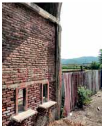
Tristi ruderi del Filadelfia