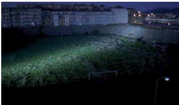
Suggestiva immagine del Fila... di notte

Passeggiando di notte, nel prato del Fila, puoi ascoltarne i pensieri, sentire quei lievi mormorii, quei vaghi fruscii che di giorno non si notano, quando è pieno dei suoni della città attorno. Se l'ascolti attentamente, se ne conosci il linguaggio, narra le vicende che abbiamo già ascoltato o vissuto, e che vorremmo ascoltare o vivere ancora. Nessuna foto, nessun documento, può descriverci così bene quelle storie, né tutte le verità che vorremmo scoprire. Nessuno potrà dirci perché e per chi, tranne l'aria del vecchio Fila. Di notte. Dopo tutti questi anni, è ancora lui il centro, il fulcro, la ragione ed il nucleo. Anche spogliato, scavato e calpestato, vive ancora. Esce solo di notte, per non disturbare più, dice. In realtà si vergogna per altri, e questo lo rende nervoso. Così ti prende il cuore per le orecchie e ti urla di non mollare, di continuare ad amare, sostenere e proteggere quel bambino vestito di granata che con il moccio al naso e le ginocchia scorticate corre dietro ogni pallone, quel ragazzo spavaldo che ha fiato per tutti e paura di nessuno, quell'uomo con i pugni stretti che lotta finché crolla ma non crolla mai, quel vecchietto che spesso scuote la testa ma è sempre lì. Da più di un secolo e per altri cento. Sempre con Te, Toro.”