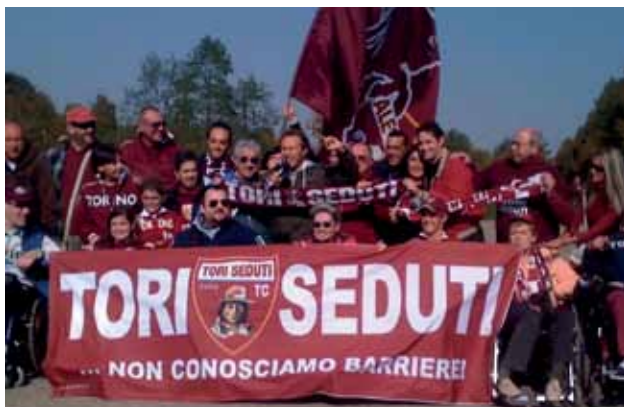
Il club dei Tori Seduti posa con lo striscione