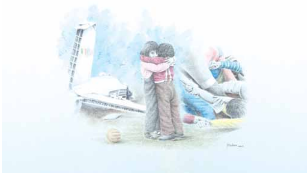
Bellissimo quadro di Giampaolo Muliari esposto al museo del Toro. "Un unico cielo", che raffigura la fratellanza di due tragedie senza barriere: Heysel e Superga