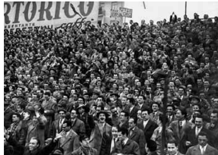
Due immagini del Filadelfia: a sinistra durante la fase di una partita e a destra la folla sugli spalti

Mi ha fatto piacere, visto che avevo tantissimi libri, fotografie, la raccolta del “Calcio Illustrato” e materiale vario sul Toro, donare tutto al “Museo della Memoria Storica Granata”, onde poterlo mettere a disposizione di tutti; tifosi del Torino e sportivi in generale, i quali ne hanno potuto beneficiare.