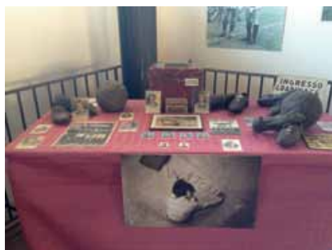
Cimeli esposti al museo del Toro: a sinistra la ruota dell'aereo schiantato a Superga e a destra una delle sale con documenti storici