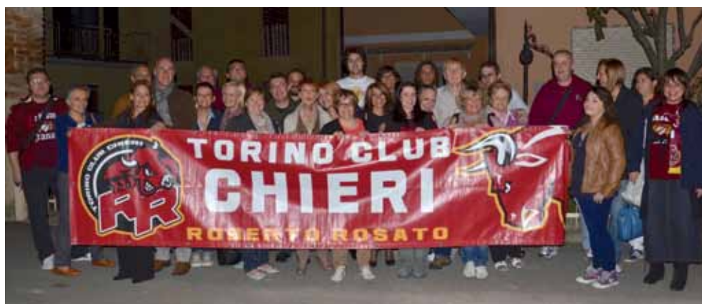
Una bella immagine del famoso “Torino Club Chieri” intitolato al giocatore granata Roberto Rosato