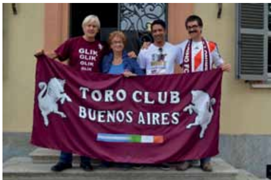
Il Toro Club Buenos Aires ospite al museo del Toro