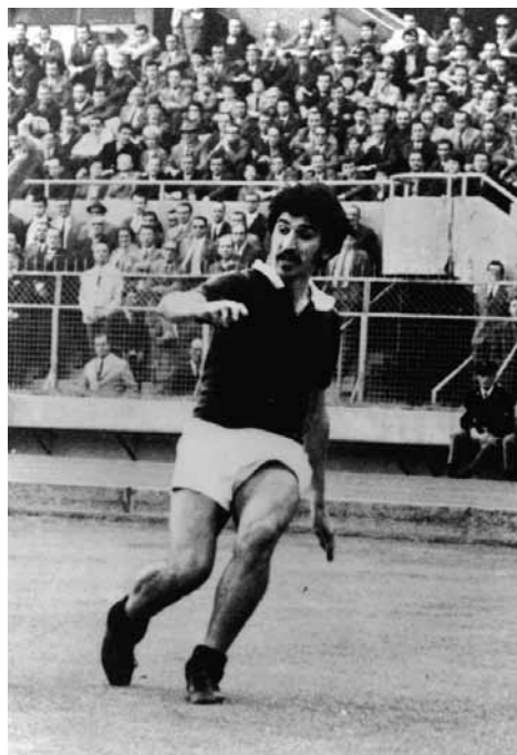
Due immagini dell'indimenticabile Gigi Meroni

La tragedia di Superga: pur se ero un tredicenne, rammento perfettamente quel giorno del 4 Maggio 1949 come se fosse ora, con quel cielo plumbeo; giocavo a pallone con i miei amici sotto casa, in piazza Vittorio, allorquando ci sorprese un tremendo temporale che ci costrinse a riparare sotto i portici a palleggiare. Ad un tratto sentimmo un rombo lontano e non riuscendo a capire cosa fosse, pensammo ad un tuono particolarmente forte ed invece... era l'aereo del Torino che si schiantava a Superga.