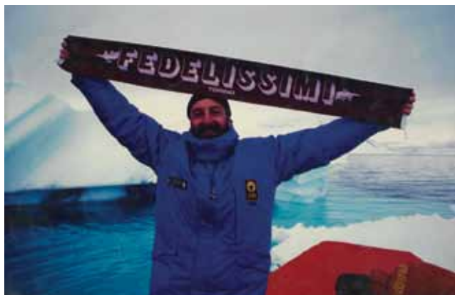
La sciarpa granata dei Fedelissimi esposta da un tifoso tra i ghiacciai del polo nord... incredibile